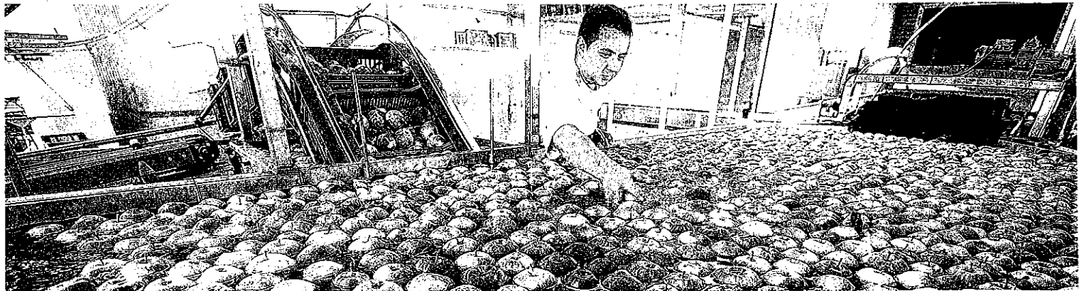
Face à la crise, les producteurs de fruits et légumes sont les grands perdants des dernières années.